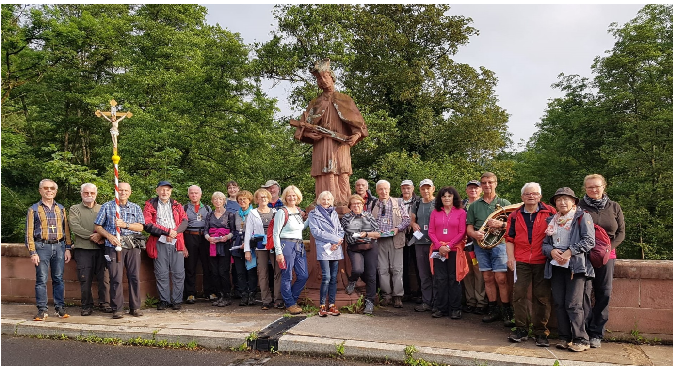
Zur frühen Morgenstunde auf der Tauberbrücke